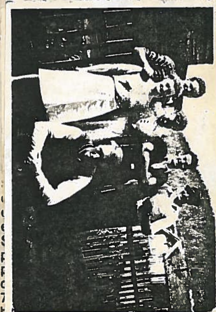
På Lillevand i 1939.