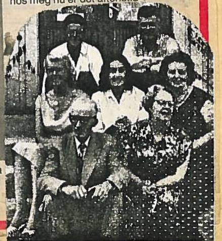
Familien på Holt.