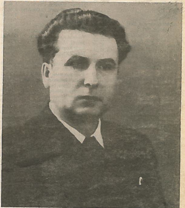
Wasseli Rjabovol bor i Marganez ved Dneper.

Først innbydelsen med oversettelsen fra norsk til russisk, og søknad til Det Sovjetrussiske Konsulat - videre