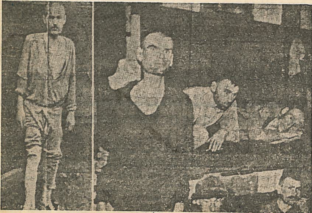
Slik ble de russiske krigsfanger funnet dypt nede i bunkersene i maldagene i 1945. Apatisk - såvidt det var liv da de ble befrikk. Det var ettusen krigsfanger i leirene på Maukstadmoen.