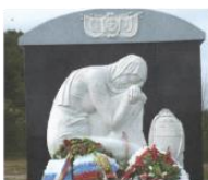
Мемориал защитникам Советского Заполярья в Долине Славы 69°18'35"N 32°12'20"E