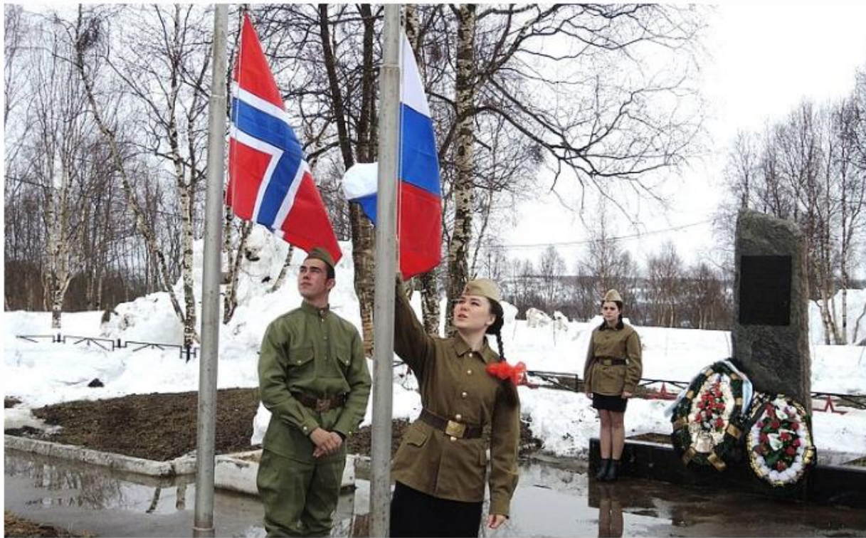
«Российско-Норвежский патриотический поход» начался с торжественной церемонии