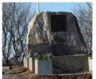
Памятник на месте казни норвежских патриотов фашистами в Киркенесе 69°42'26"N 30°02'20"E