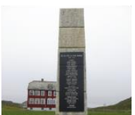
Стела в Киберге норвежским патриотам, погибшим за освобождение Норвегии 70°17'15"N 30°59'36"E