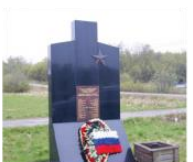
Памятник погибшим в боях за освобождение Нейдена 69°42'15"N 29°15'4"E