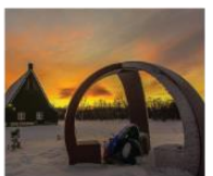
Памятный знак 70-летию освобождения Финнмарка в Тане 70°23'58"N 28°11'05"E