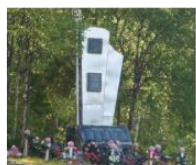
Остров Партизанский, база отрядов «Советский Мурман» и «Большевик Заполярья» 67°51'01"N 28°42'33"E