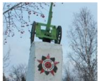
Памятник в Ахмалатхи погибшим в Петсамо-Киркенесской операции 69°29'17"N 30°10'34"E