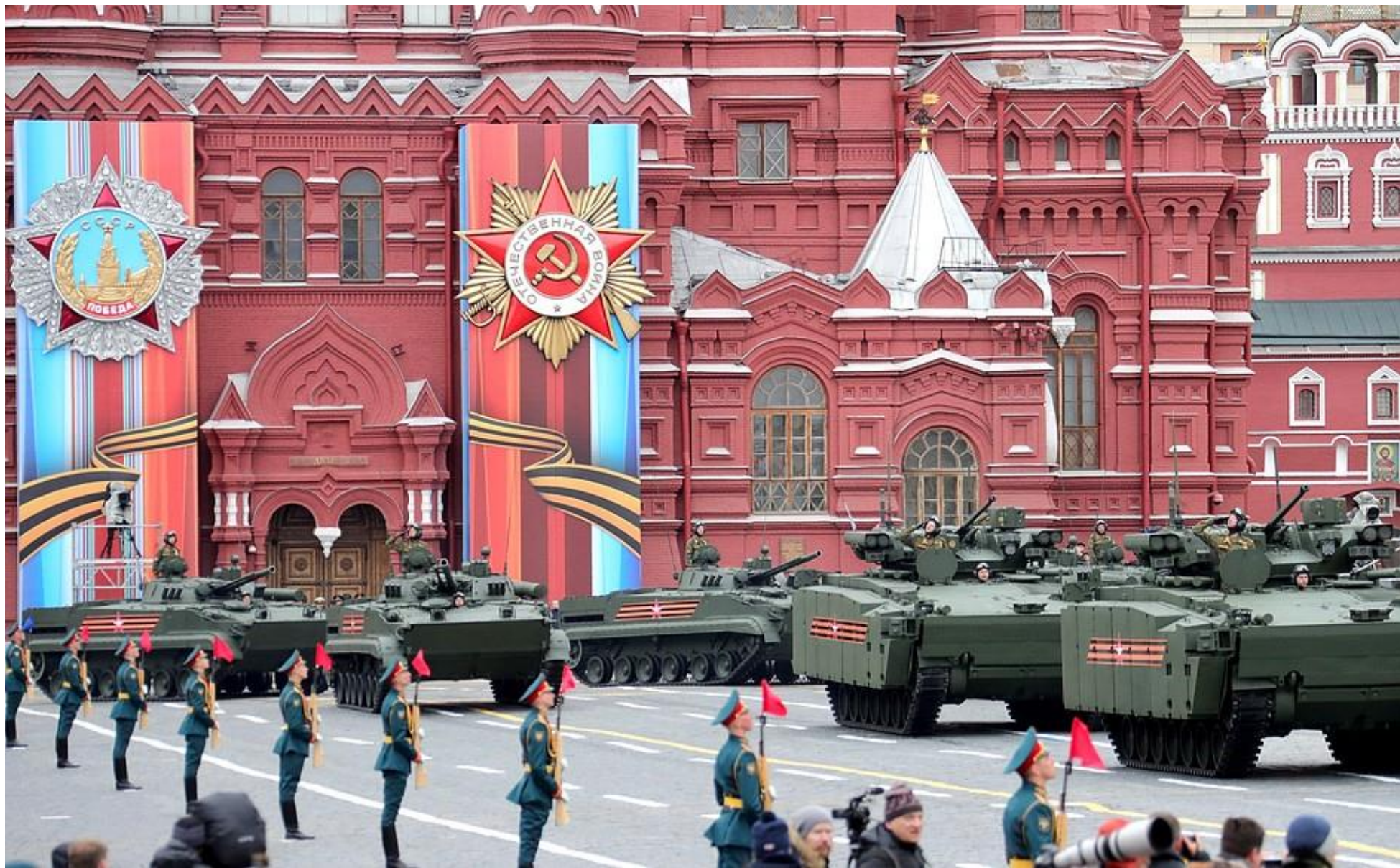
Militærparade på Den røde plass i Moskva, 9. mai 2017