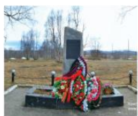
Памятники советским воинам и норвежским патриотам в посёлке Междуречье 69°2'0"N 32°56'44"E