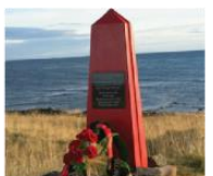
Обелиск на месте гибели партизанской группы на мысе Лангбюнес 70°15'02"N 30°42'04"E