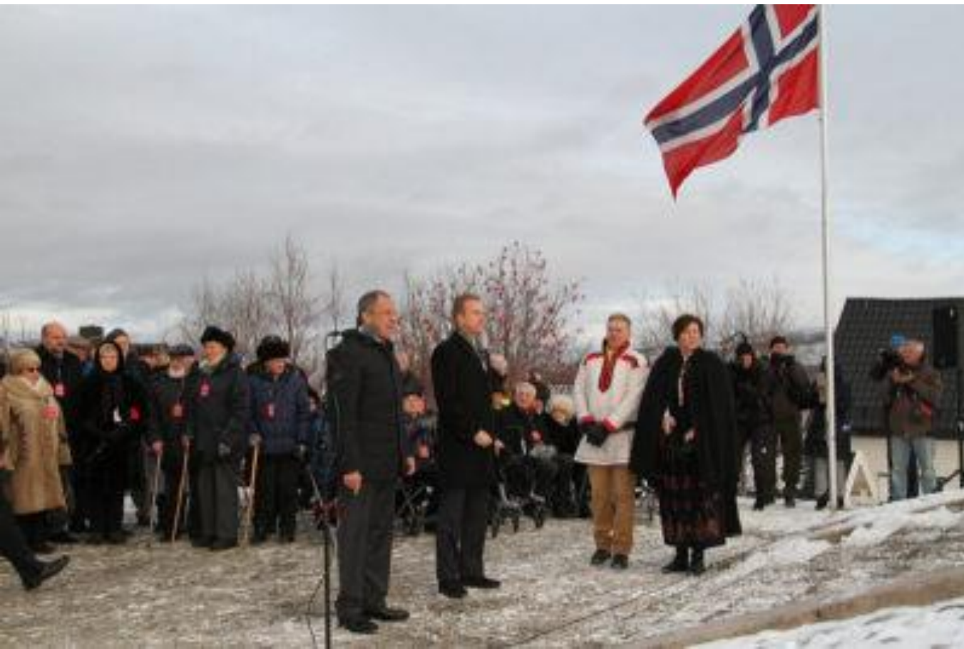
Frigjøringsmarkering i Kirkenes, oktober 2014