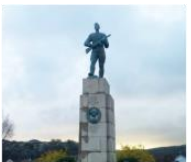
Памятник советским воинам-освободителям в Киркенесе 69°43'40"N 30°02'58"E