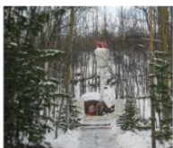
Памятный знак на месте захоронения партизан «Партизанский кедр» 68°50'06"N 32°53'58"E