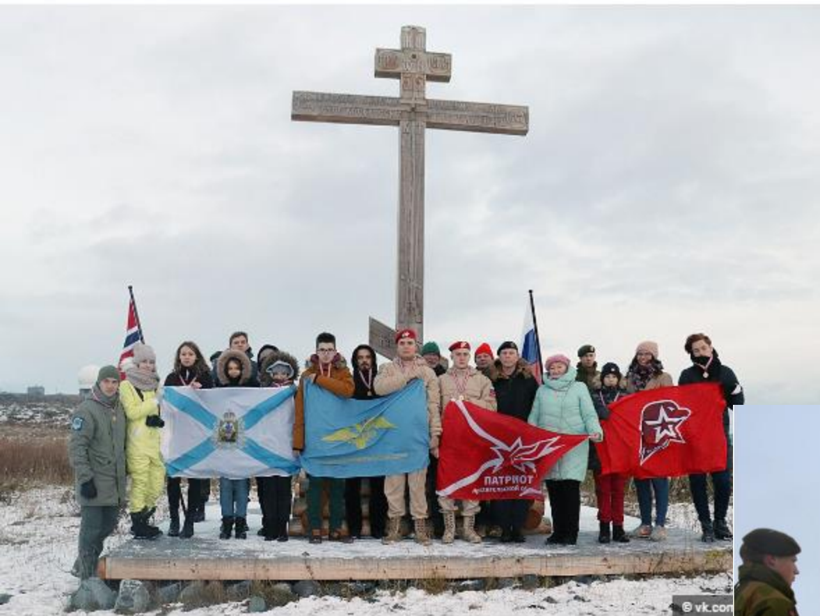
Экспедицию в Норвегию ребята запомнят на всю жизнь.