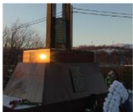
Памятник-звонница защитникам Советского Заполярья в Титовке 67°51'01"N 28°42'33"E