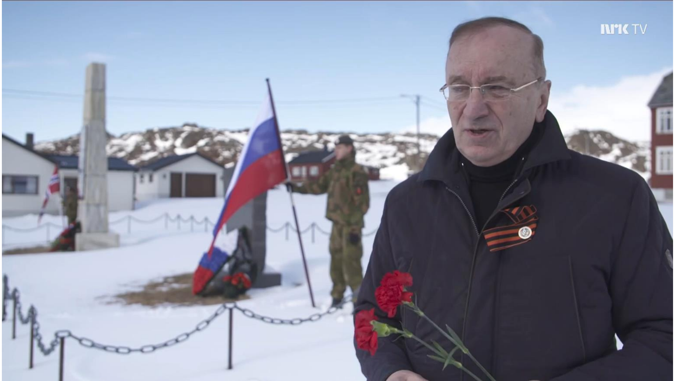
Senator Igor K. Tsjernysjenko fra Murmansk på krigsminnemarkering i Kiberg, mai 2019