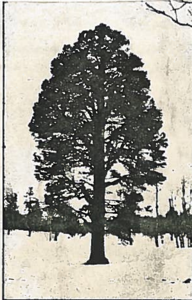
Dronningen paa Diviåsen.