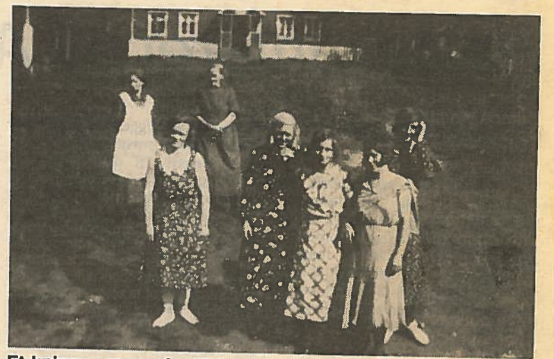
Et knippe «møer» fra Kirkesdalen. Er det noen som