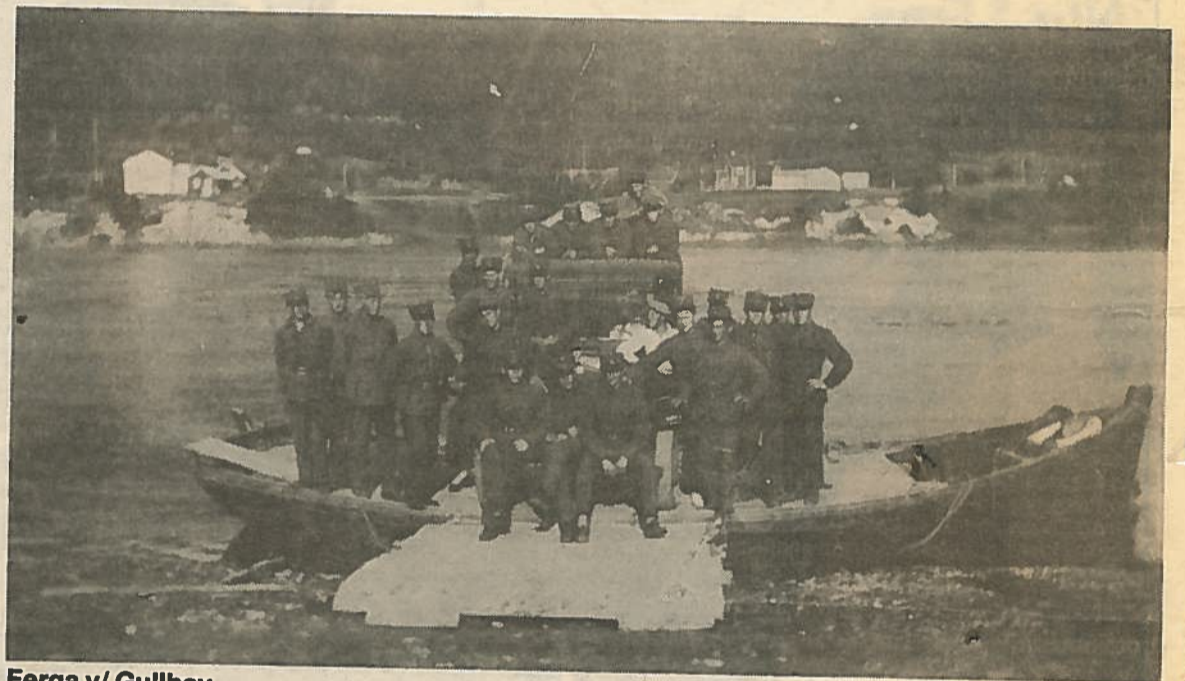
Ferga v/ Gullhav.