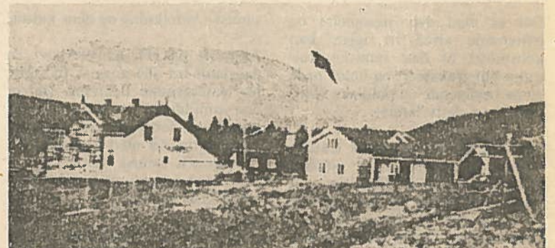
Slik var gården den gang i 1940 da Nygårdsvold bodde der.

Det ble vanskelig å holde statsråd, da regjeringen var spredt over fylket. Så den 14de mai reiste statsminister med følge til Tennes og videre til Tromsø. Der bodde de først i Bispegården. Oppe i Tromsø ble alt kritisert hva regjeringen gjorde som angikk Nord-Norge. De ble kritisert og be-