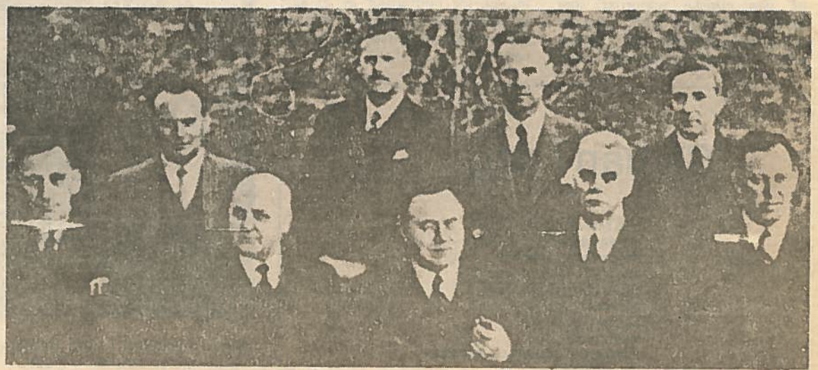
En del av statsrådene i Nygårdsvolds-regjeringen i 1940.

Det sivet nok ut at regjeringsmedlemmer var kommet til bygda, men det ble ikke snakket noe om det. Var en selvfølge å holde stille om det. Ingen kunne vite om tyskerne kunne få «snøsen» i hvor de var stasjonert?