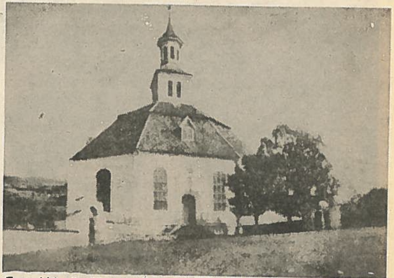
Fronskirke fra Listad, på Hundorp i Gudbrandsdalen.