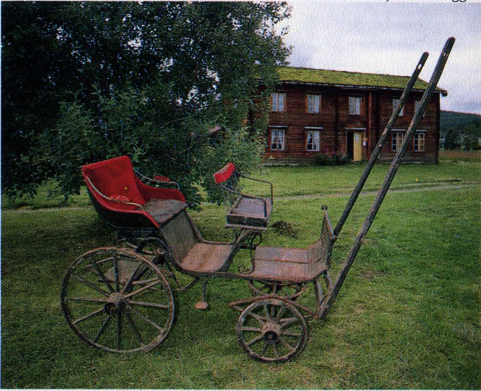
Hestetrille fra Sandeggen.