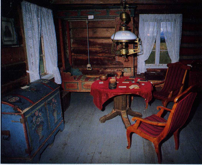
Interiør fra Fossmostua.