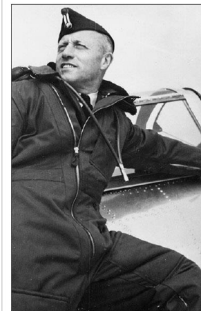
RAPPORTER TE: Takket være flere rapporter fra oberstløytnant Ole Reistad vet man en del om det som skjedde med de sovjetiske krigsfangene på Bardufoss etter frigjøringa våren 1945.

MÅLSELV: 21 sovjetiske krigsfanger ble i slutten av juni 1945 innlagt på sykehus etter at de hadde drukket trespritt på Bardufoss. Sju av dem døde.