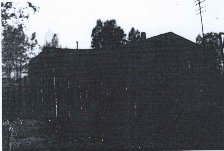
Fangelieren slik han såg ut under krigen. Same stad kor "Pølsefabrikken", "Snackbaren", og no "Blåhuset" ligg.

Dei russiske fangane på Rundhaug bestod av anslagsvis 70-80 menn, inkludert 8-9 offiserar. Offiserane var plasserte i ein stall som stod tom under krigen fordi hestar og